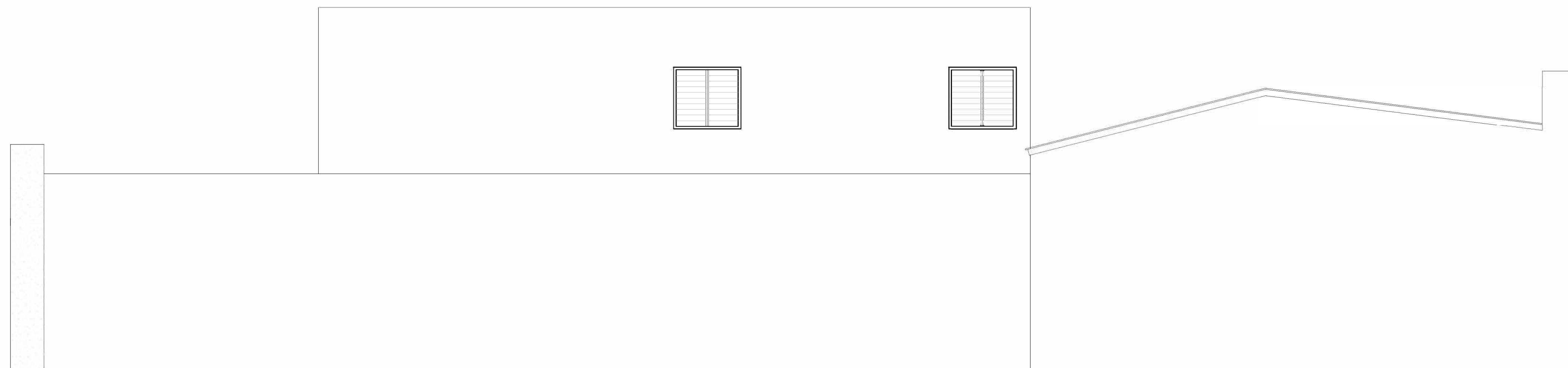
ELEVACIÓN LATERAL IZQUIERDA